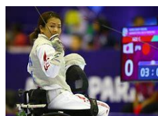
パラフェンシング