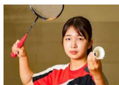
デフバドミントン